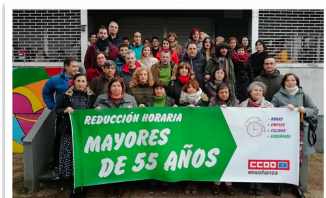
Movilización convocada por CCOO exigiendo la reducción horaria para mayores de 55 años

La jornada laboral de los docentes itinerantes será la establecida con carácter general para el cuerpo al que pertenezcan, teniendo en cuenta las compensaciones semanales de reducción de períodos lectivos de docencia directa que se detallan más adelante.